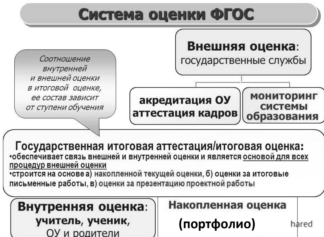
Рис. 2. Система оценки достижения планируемых результатов

Полученные данные используются для оценки состояния и тенденций развития системы образования разного уровня (рис. 2).