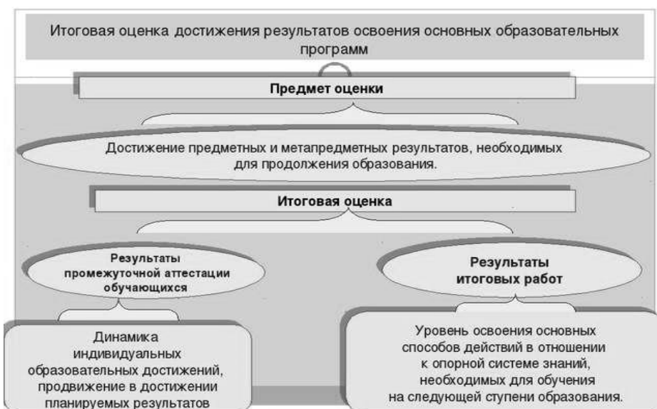
Рис. 3. Достижение предметных и метапредметных результатов, необходимых для продолжения образования. Итоговая оценка.

На итоговую оценку на уровне основного общего образования выносятся только предметные и метапредметные результаты, описанные в разделе «Выпускник научится» планируемых результатов основного общего образования.