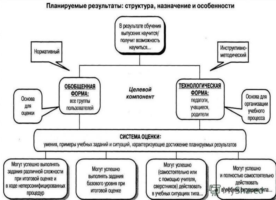
Рис. 1. Особенности структуры планируемых результатов. Функция и назначение.

3) обеспечивает комплексный подход к оценке результатов освоения основной образовательной программы основного общего образования, позволяющий вести оценку предметных, метапредметных и личностных результатов основного общего образования;